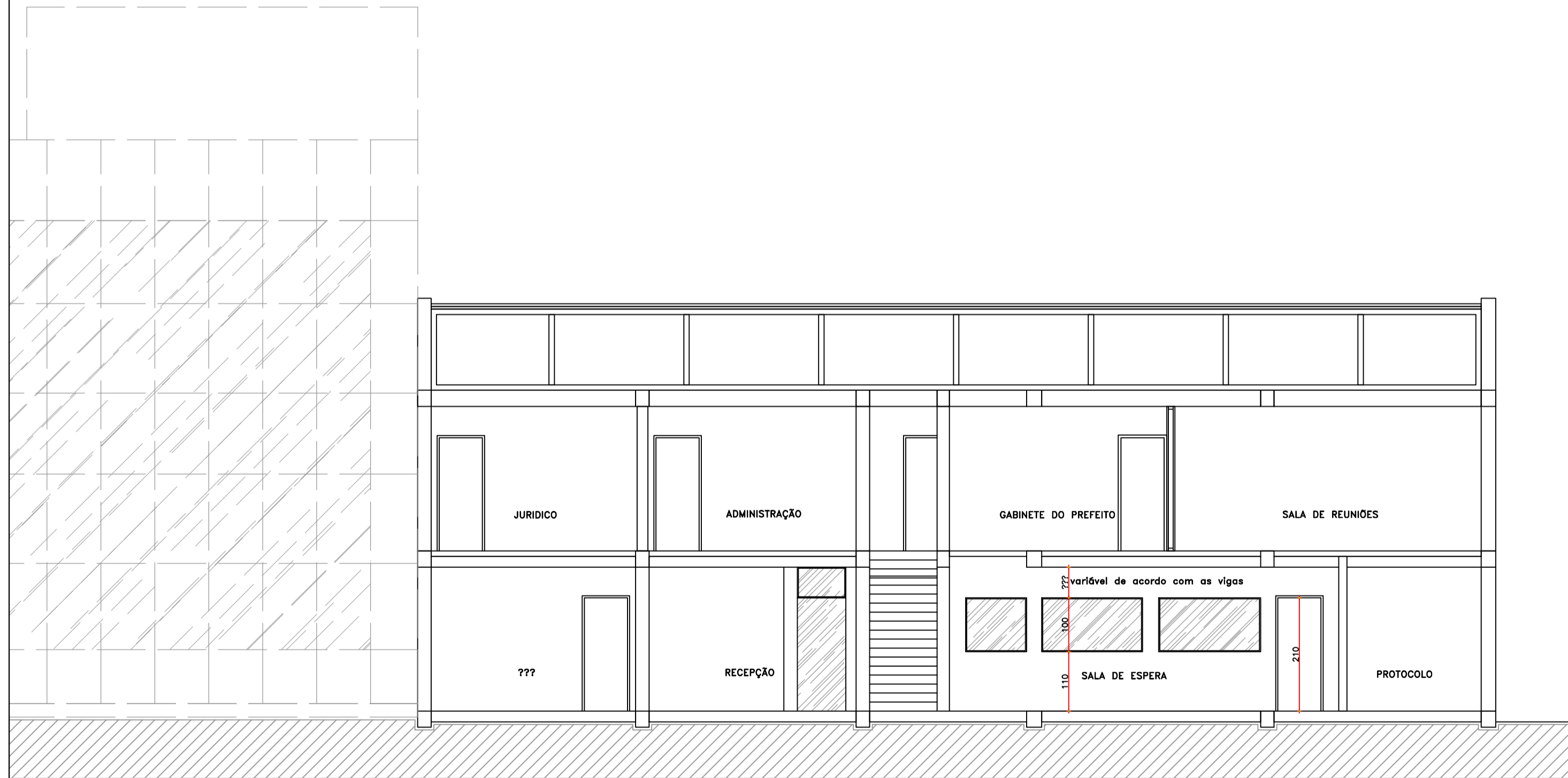
CORTE DETALHE DRY WALL ESCALA 1:75