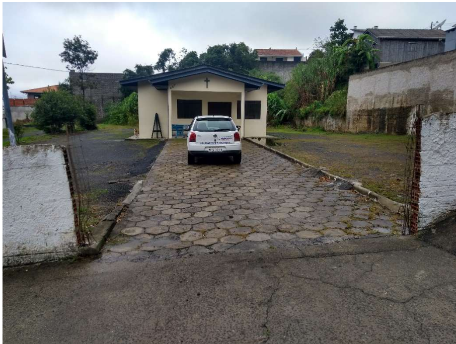
Foto 2 – Vão de acesso com muro a ser reformado e colocação de grades no vão