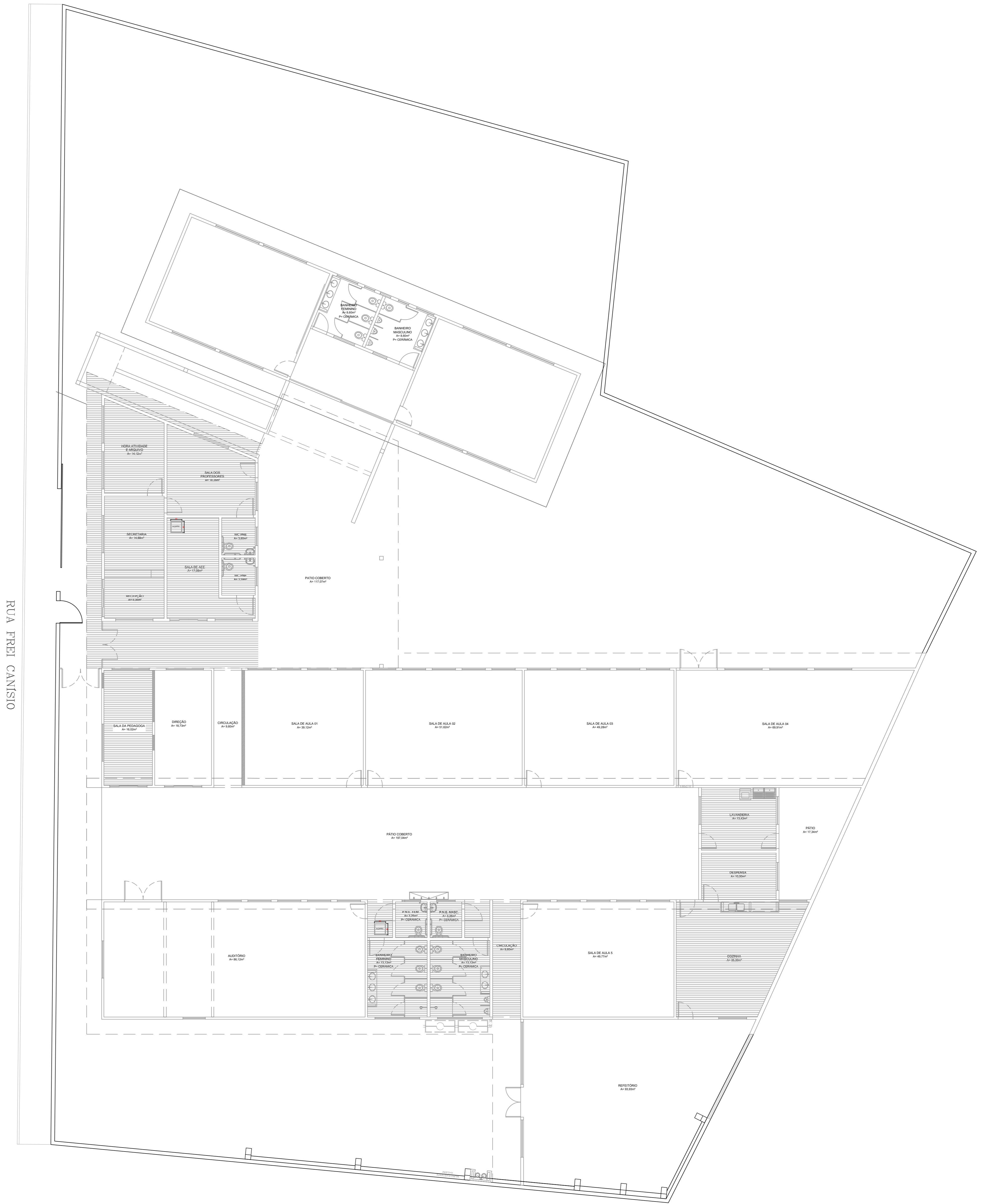
PLANTA DE FORROS (NOVOS E A REFAZER) ESCALA 1/100